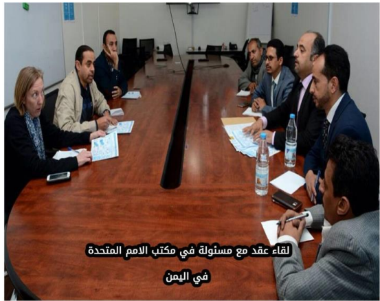
لقاء عقد مع مسؤولة في مكتب الامم المتحدة في اليمن