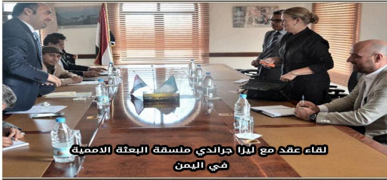
لقاء عقد مع ليزا جراندي منسقة البعثة الاممية في اليمن