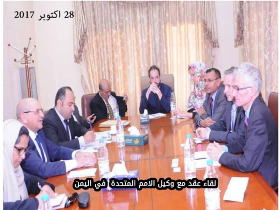
28 أكتوبر 2017

تراقب الهيئة العامة للتأمينات في صنعاء والمتقاعدين المحرومين في المحافظات الشماليه ما ستصل اليه جهود اللجنة المجتمعيه والنقاييه التي نزلت الي محافظه عدن من اجل الالتقاء بالمسولين هناك ومناقشه سبل صرف المعاشات لكافة المتقاعدين في عموم المحافظات بشكل عادل وبدون تمييز خاصة وان اللجنه الموجوده في عدن قد استلمت من الهيئه في صنعاء كل المتطلبات اللي طلبوها في عدن مثل كشوفات المتقاعدين وقاعده بيانات المتقاعدين بالاضافه الي مبادرات قامت بها الهيئه في صنعاء مثل تعزيز كامل المبالغ المطلوبة شهريا بحوالي ٢ مليار شهريا وتعتبر اللقاءات الاخيريه الحاصله حاليا في عدن تطورات ونتائج لتحركات وفعاليات مختلفه ولقاءات سابقه عقدت في صنعاء، مع ممثلي مكاتب الامم المتحده فضلا عن اقامه حلقات نقاشيه وورش عمل اقيمت في صنعاء وكان السؤلون في عدن قد صرحوا بلسان بن دغر انهم سيصرفون المعاشات واعلنت حكومة عدن انها ستدفع معاشات المتقاعدين ورغم تلك التصريحات المتكررة من اكثر من مسؤول في عدن ورغم توفر السيولة بحوزتهم الا انهم لم ينفذوا وعودهم والتزاماتهم تجاه المتقاعدين المدنيين