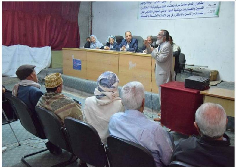
الحلقة النقاشية ركزت حول الصعوبات والحلول الممكنة لصرف معاشات المتقاعدين