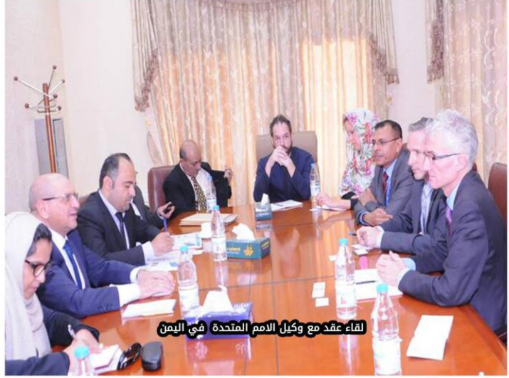
لقاء عقد مع وكيل الامم المتحدة في اليمن

أكد رئيس الهيئة العامة للتأمينات والمعاشات الأستاذ إبراهيم أحمد الحيفي أنه من الضروري صرف معاشات متقاعدين الذين أفنوا أعمارهم لأكثر من 35 عام في خدمة الوطن وكانت رواتبهم يستقطع منها اشتراكات شهرية لغرض الحصول على معاش تقاعدي عند إحالتهم للتقاعد . وقال الحيفي خلال لقائه وكيل الأمين العام للأمم المتحدة للشؤون الانسانية (منسق الاغاثة الطارئة) مارك لوكوك (أنه توقفت صرف المعاشات التقاعدية منذ شهر مارس 2016 وحتى الآن لععدد المتقاعدين 39078 وهذه معاناة انسانية حقيقية يرجع سببها الى عدم توفر السيولة النقدية في بعض محافظات الجمهورية اليمنية بسبب نقل البنك المركزي من العاصمة صنعاء الى مدينة عدن واطاف قائلا ان الهيئة العامة للتأمينات والمعاشات كانت تصرف معاشات كل المتقاعدين لجميع المحافظات اولا باول دون انقطاع وبلا استثناء رغم الأزمات التي مرت بها البلاد الى ان جاء قرار نقل البنك المركزي هذا بدوره سبب كارثة إنسانية للمتقاعدين وأسره فهم بحاجة ماسة الى الاحتياجات اليومية الاساسية التي تبقىهم على قيد الحياة من غذاء ودواء فأغلبهم يعانون من امراض مزمنة تحتاج الى علاجات مستمرة مدى الحياة والا فسيفقدون حياتهم كما انهم كبار في السن وغير قادرين على العمل ومعاشاتهم التقاعدية هي العائل الوحيد لهم ولاسرهم خلافا عن المشاكل النفسية والمستقبلية التي تنتج بسبب عدم القدرة المالية